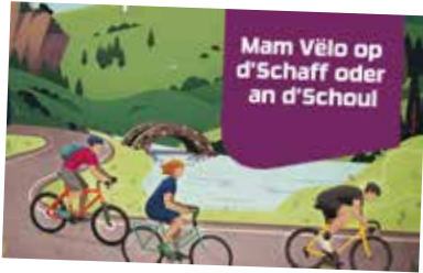
Participatioun bei Mam Velo an d'Schoul