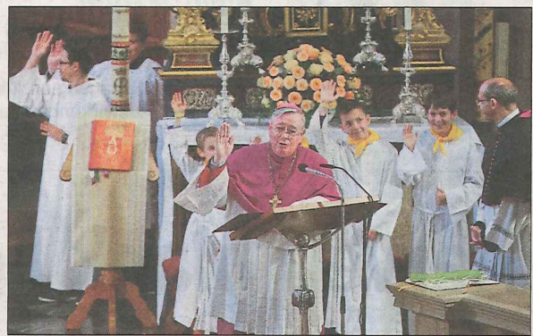
Erzbischof Jean-Claude Hollerich bei der Begrüßung der Marienvereher der neuen Pfarreien „Wooltz Saints-Pierre-et-Paul“ und „Öwersauer Saint-Pirmin“.