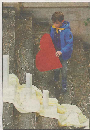
Auf der Suche nach dem rechten Fleck für das große rote Herz.