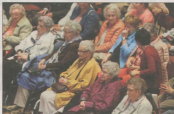
Andächtig und im Gebet vertieft: ein Teil der Pilger der neuen Pfarreien „Wooltz Saints-Pierre-et-Paul“ und „Öwersauer Saint-Pirmin“.