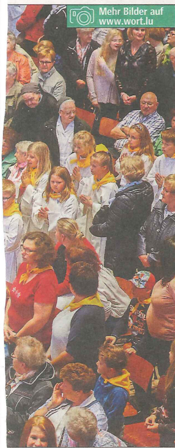
Ein farbenfrohes Bild: beim Einzug für die Oktavmesse der neuen Pfarreien „Wooltz Saints-Pierre-et-Paul“ und „Oewersauer Saint-Pirmin“ gestern Vormittag im Mariendom.